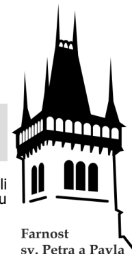
Farnost sv. Petra a Pavla

Bohoslužby v Semilech se konají v děkanském kostele sv. Petra a Pavla (KO), v kapli sv. Zdislavy na faře (KA), ve filiálním kostele Umučení sv. Jana Křtitele na Koštofranku (KK), v domově důchodců (DD), v kapli sv. Antonína v Chuchelně (CH).