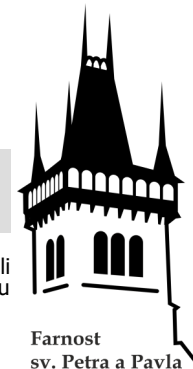
Farnost sv. Petra a Pavla

Bohoslužby v Semilech se konají v děkanském kostele sv. Petra a Pavla (KO), v kapli sv. Zdislavy na faře (KA), ve filiálním kostele Umučení sv. Jana Křtitele na Koštofranku (KK), v domově důchodců (DD), v kapli sv. Antonína v Chuchelně (CH).