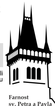
Farnost sv. Petra a Pavla

Bohoslužby v Semilech se konají v děkanském kostele sv. Petra a Pavla (KO), v kapli sv. Zdislavy na faře (KA), ve filiálním kostele Umučení sv. Jana Křtitele na Koštofranku (KK), v domově důchodců (DD), v kapli sv. Antonína v Chuchelně (CH).