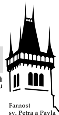
Farnost sv. Petra a Pavla